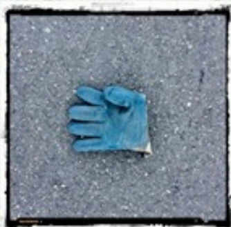
Ri-MAFLOW, Trezzano sul Naviglio (2019)

Un incontro per esplorare il senso di ciò che oggi è il «lavoro». I linguaggi artistici restituiscono la memoria del lavoro o provano a decifrare i cambiamenti. Esperti e testimoni da mondi differenti raccontano la fragilità e la resistenza del lavoro e dei lavoratori, in particolare dei soggetti più deboli.